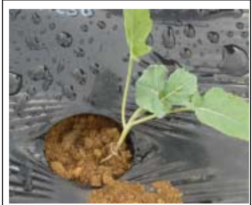
マルチ穴より高温の空気が上がってくることにより苗が傷む。特に7～8月植えにおいては厳禁である。