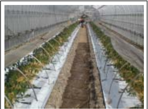
日中の換気状況。白黒ダブルマルチを使っているが適切ではない。