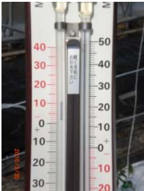
あるハウスの 3 月 30 日の気温計(この日の日中の最高気温は 8.4 であったが、快晴日で換気していないハウスの中は 50 を記録していました。)

ており、植え替えが必要な圃場も見つけられております。今後も引き続き気象の不安定な状況が続く見込みですので、最高最低温度計や地中温度計を設置しハウスの温度管理は十分に注意していただきますようお願いいたします。なお、温度計の設置は植物の生長点の高さと、地中は 15 cm くらいの深さで測定して下さい。