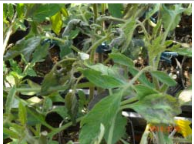
育苗中のトマトの低温による障害(凍害)ハウスの中といっても、加温していない限り、温度は外気温より 1~2 高い程度です。この日は外気温がマイナス 2 まで下がっていたため、ハウス内であっても相当気温が下がっていたと推測されます。